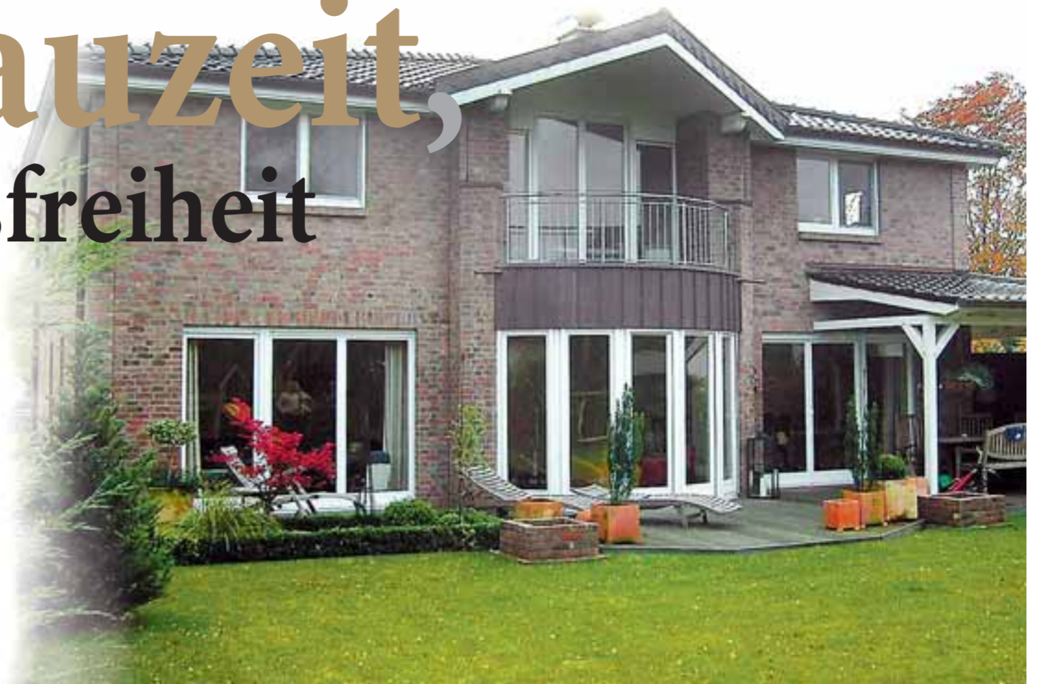
Bei einem Grundhaus sind Bauherren architektonisch so gut wie keine Grenzen gesetzt.

betreuende Bauleiter vertritt strikt die Interessen des Hausebauers und nicht die der beauftragten Handwerker, denn schließlich bekommt er sein Geld vom Bauherrn.